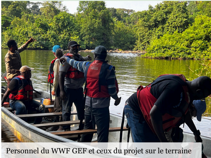
Personnel du WWF GEF et ceux du projet sur le terrain

Parmi les difficultés identifiées figurent l'état dégradé des routes limitant l'accès à certaines zones, ainsi qu'un besoin de renforcement des capacités de certains partenaires sur les normes environnementales et sociales. Pour y remédier, des recommandations ont été formulées à l'endroit des partenaires de mise en œuvre, de l'Unité de Gestion du Projet et des administrations sectorielles : documentation rigoureuse des activités, suivi régulier sur le terrain, amélioration de la communication entre acteurs, et accompagnement institutionnel accru. Grâce à une collaboration renforcée entre tous les acteurs, le projet continue de contribuer durablement à la préservation des forêts du bassin du Congo et au bien-être des populations locales.