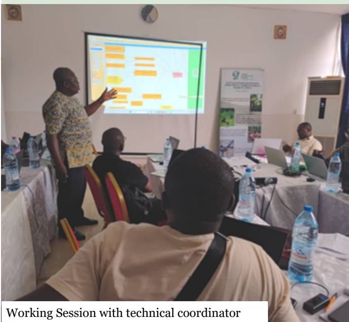
Working Session with technical coordinator

With these concrete steps, the new management plan for Campo-Ma'an is moving steadily from a working document to an on-the-ground reality for conservation and community well-being.