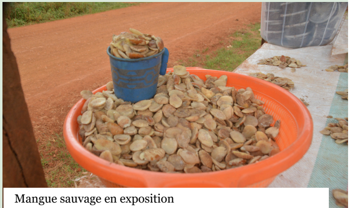
Mangue sauvage en exposition

de collecte en forêt par les écogardes de Safari, les conflits hommes-éléphants, le manque de pièces détachées pour les concasseuses, et l'état dégradé des routes qui rend le transport des produits et du matériel hors de prix. L'équipe de mission a formulé des recommandations claires. ROSE doit trouver d'urgence des acheteurs alternatifs à Yokadouma ou Bertoua pour écouler les stocks avant la prochaine saison. La « stratégie Baka », une ristourne supplémentaire de 10 % accordée aux