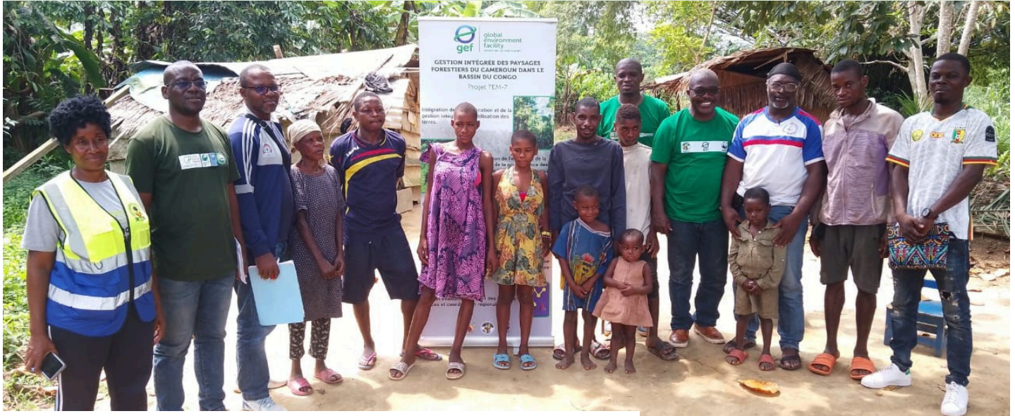
Quelques personnels du projet et les membres de la communauté Bagyeli

Février et mars 2026 ont marqué une étape clé dans la mise en œuvre du projet. Deux événements complémentaires ont renforcé l'approche inclusive et responsable de la conservation au sein du Parc National de Campo Ma'an (PNCM), sanctuaire de biodiversité de 264 064 hectares situé dans la région du Sud.