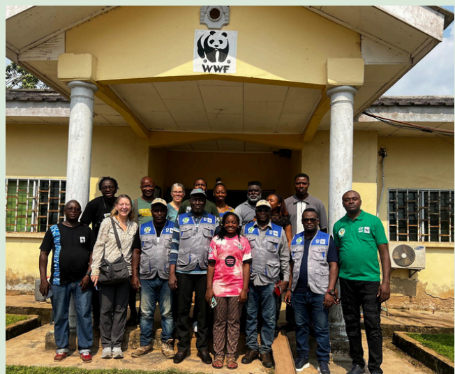
Personnel GEF 7 IP Cam and WWF GEF Agency