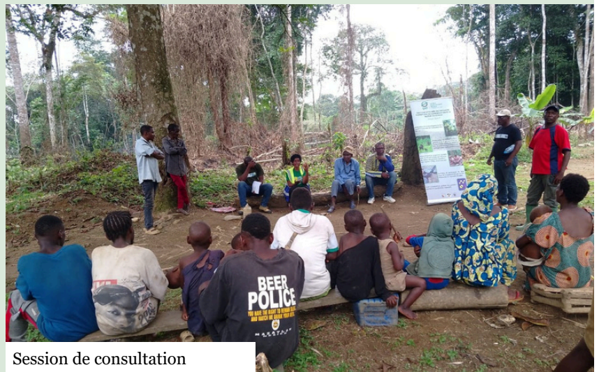
Session de consultation