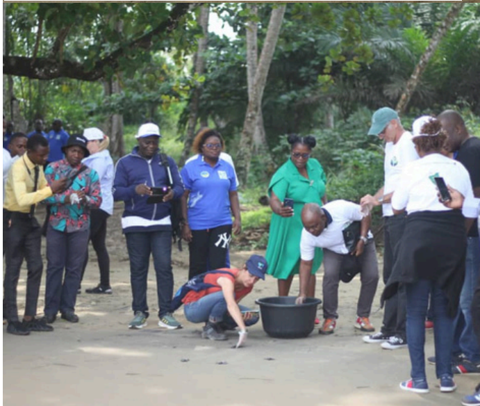
Hatchlings released from project's hatchery