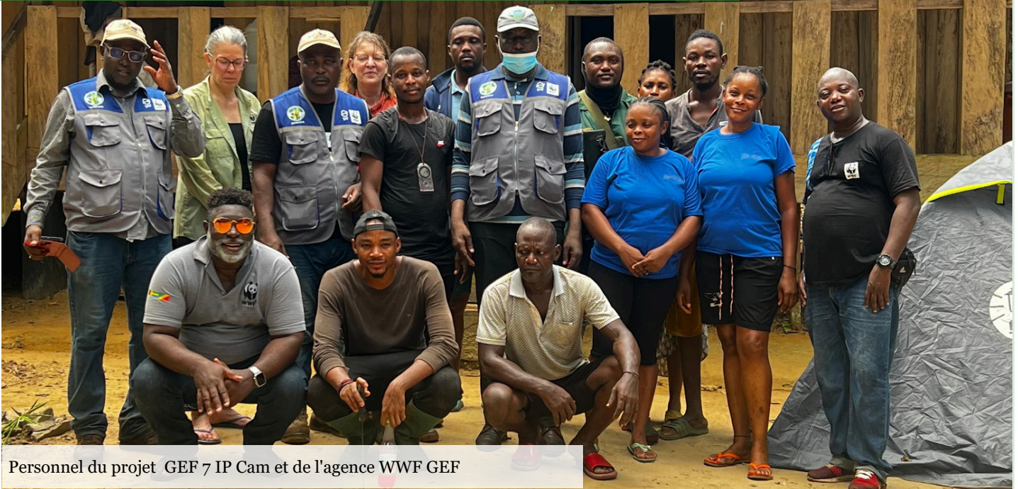
Personnel du projet GEF 7 IP Cam et de l'agence WWF GEF

Une mission de suivi s'est déroulée du 03 au 10 mars 2026 dans le paysage Campo-Ma 'an-Rio-Campo (CMRC) dans le cadre du projet « Gestion intégrée des paysages forestiers du Cameroun dans le bassin du Congo ». Cette initiative, financée par le Fonds pour l'Environnement Mondial (FEM) et mise en œuvre par le MINEPDED avec l'appui stratégique du WWF-US, vise à allier conservation de la biodiversité et amélioration des moyens de subsistance des communautés locales.