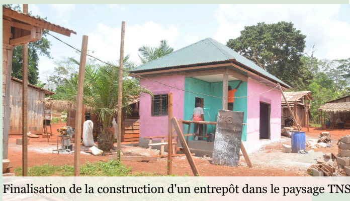
Finalisation de la construction d'un entrepôt dans le paysage TNS