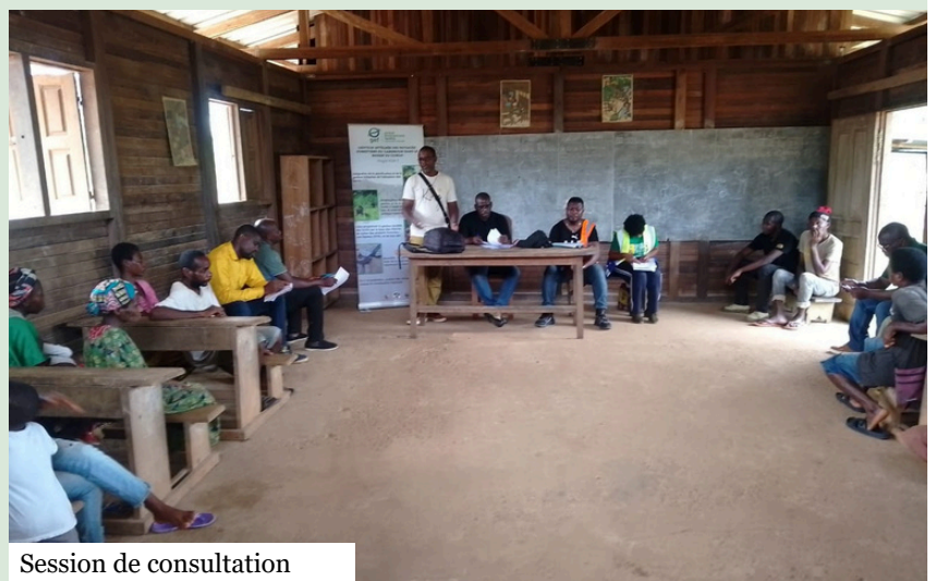
Session de consultation