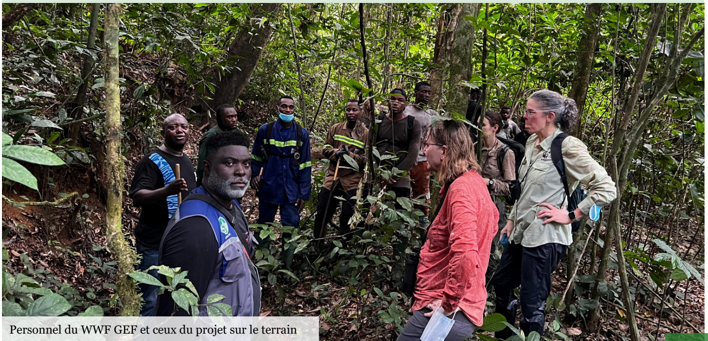
Personnel du WWF GEF et ceux du projet sur le terrain