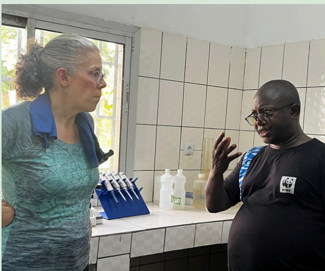
Personnel du projet qui fournit des informations vitales

Les échanges ont permis de constater l'engagement effectif des partenaires dans la mise en œuvre des activités. Les actions de gestion du parc national, les patrouilles de surveillance menées par les écogardes et le programme d'habitation des gorilles illustrent la dynamique positive en cours. Par ailleurs, les