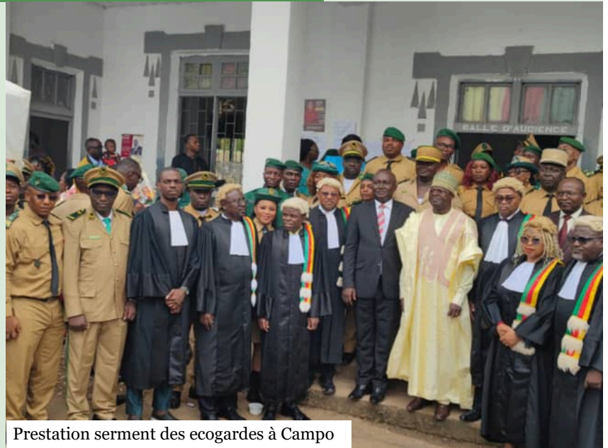
Prestation serment des ecogardes à Campo

À l'issue de ces consultations, plusieurs recommandations ont été formulées : le MINFOF est invité à intégrer durablement les savoir-faire Bagyeli dans la gestion du parc ; Le projet GEF 7 IP Cam, ainsi que divers partenaires à la conservation sont sollicités pour soutenir des activités génératrices de revenus et renforcer les capacités communautaires ; enfin, les communautés elles-mêmes sont appelées à participer activement aux prochains ateliers de validation. Aucun défi majeur n'a entravé ces actions, si ce n'est l'accessibilité difficile de certains campements. Pour les mois à venir, des rencontres consultatives avec l'ensemble des parties prenantes locales, une évaluation des besoins des rangers en infrastructures et en formation, ainsi qu'un appui technique aux guides touristiques de l'initiative communautaire EBOTOUR sont prévus.