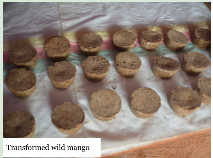
Transformed wild mango

As the tour concluded, GEF 7 reaffirms its commitment to two core pillars: sustainable forest governance and the economic empowerment of Indigenous Peoples and local communities—with a special focus on women. The message from Mintom, Ngoyla, and Lomié is that with the right support, forest communities are not just protecting nature; they are building better futures, while also being able to sustainably manage their resources.