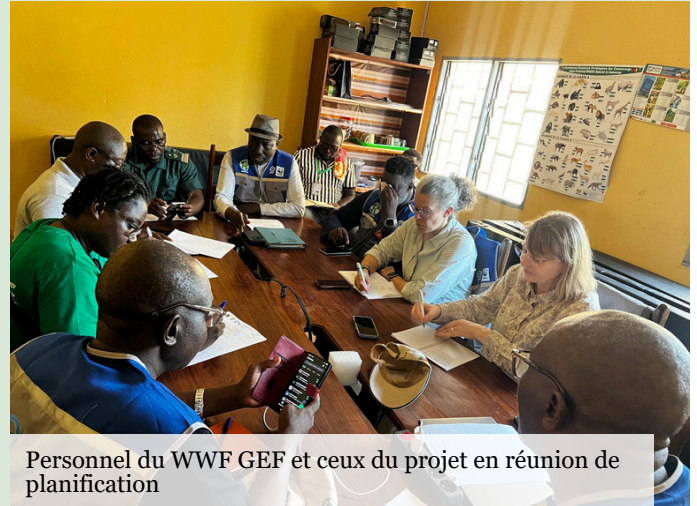
Personnel du WWF GEF et ceux du projet en réunion de planification