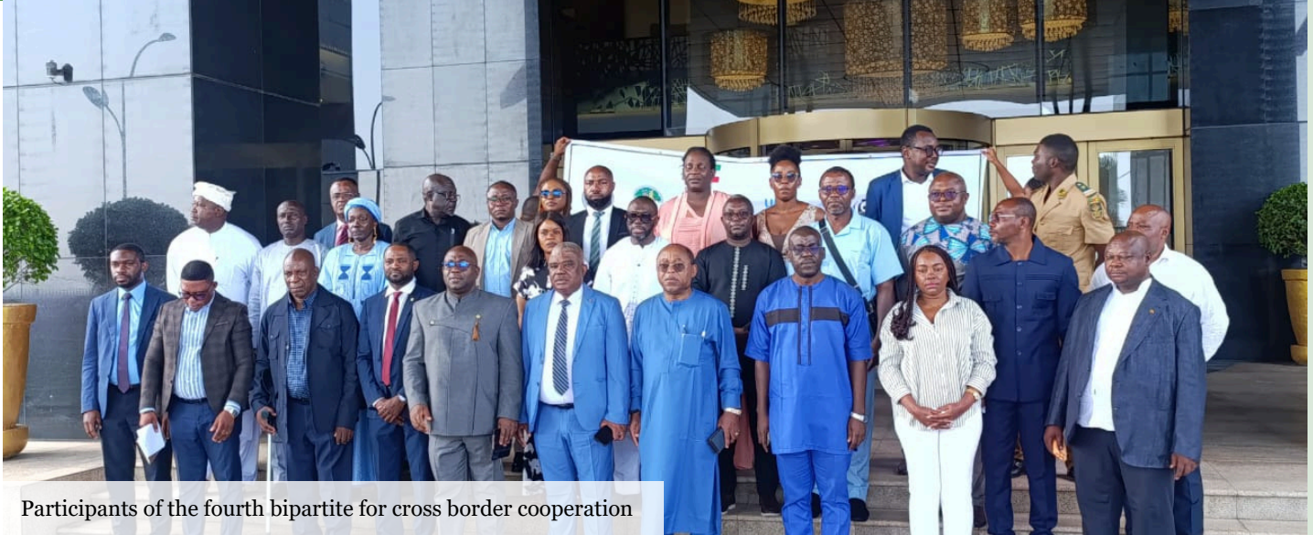
Participants of the fourth bipartite for cross border cooperation

As part of the drive to conserve shared ecosystems, the fourth bipartite (concerning two parties) meeting between Cameroon and Equatorial Guinea was held in Bata on March 26 and 28, 2026. This meeting marks a decisive step towards the signing of a binational agreement to ensure the harmonious management of the Campo-Ma'an – Rio Campo (CMRC) landscape, one of three landscapes of the GEF-7 Impact Program.