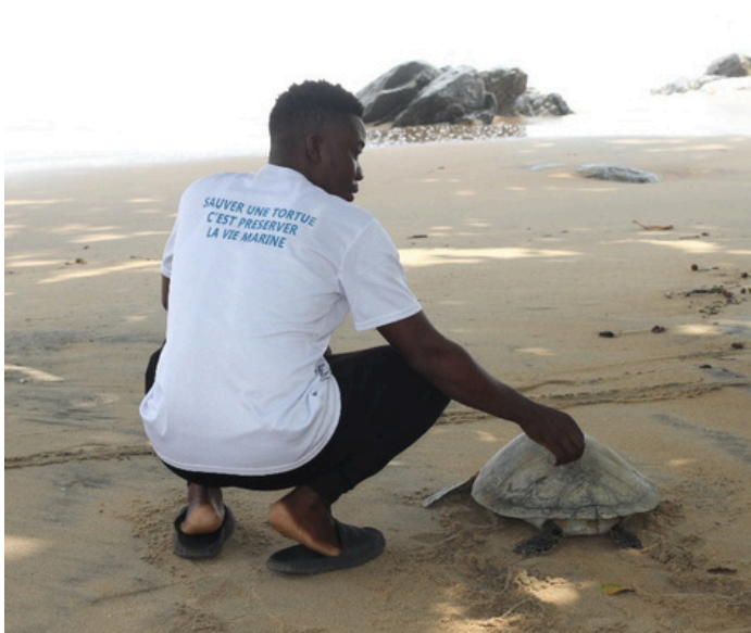
Turtle from project hatchery