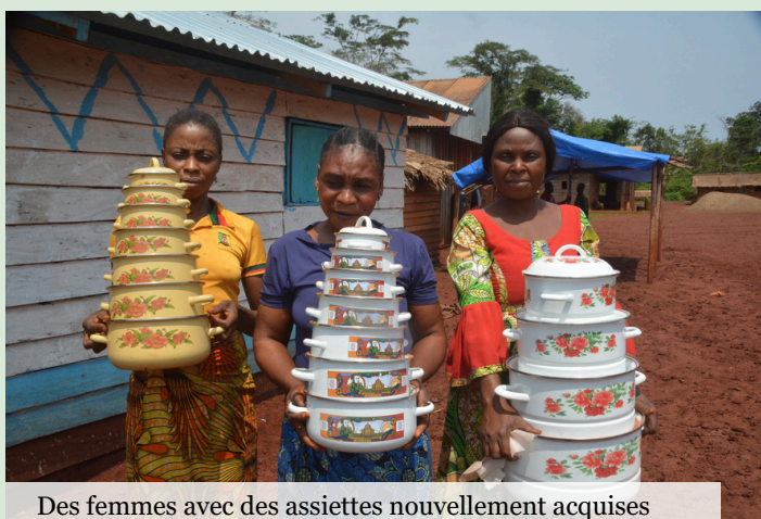
Des femmes avec des assiettes nouvellement acquises

Les incompréhensions sur le mécanisme persistent. Beaucoup de membres, surtout les Baka, pensaient que le fonds de roulement était une subvention sociale directe plutôt qu'un outil d'appui à la structuration des filières. De ce fait, certains préfèrent vendre aux commerçants ambulants pour obtenir de l'argent immédiat, contournant les ventes groupées qui permettraient d'obtenir de meilleurs prix. S'ajoutent à cela : le retard de décaissement des petites subventions.