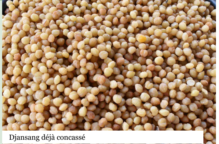
Djansang déjà concassé