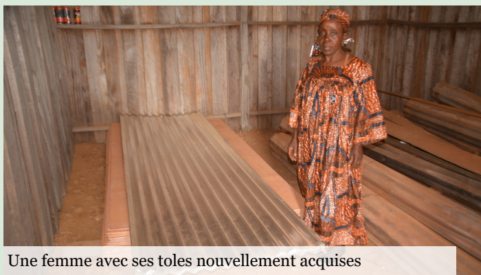
Une femme avec ses toles nouvellement acquises