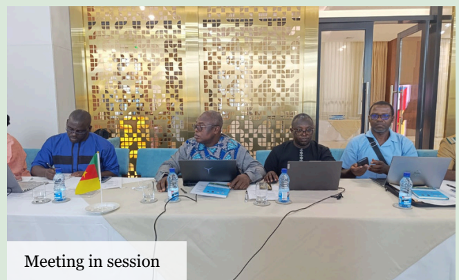
Meeting in session

The coming weeks will be dedicated to implementing the remaining actions outlined in the roadmap. The signing, eagerly anticipated by technical and financial partners, will seal an exemplary collaboration in service of biodiversity and sustainable development in the Campo-Ma'an – Rio Campo landscape.