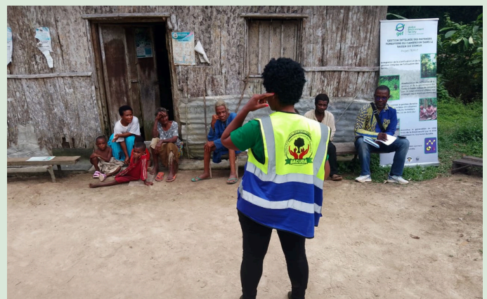
Présidente de BACUDA qui parle aux membres de la communauté

Les échanges, menés en français et en langue locale avec l'aide de la présidente de l'association BACUDA, ont permis d'identifier des préoccupations majeures : restriction d'accès aux ressources forestières, accaparement des terres, besoins d'activités génératrices de revenus (élevage de porcs et volailles),