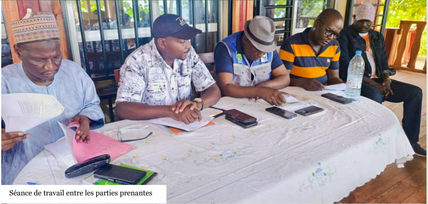
Séance de travail entre les parties prenantes

Du 11 au 14 mars 2026, une mission de suivi de haut niveau, conduite par le Directeur National du Programme à impact et le point focal du MINTOUL, s'est rendue dans le paysage de Campo.