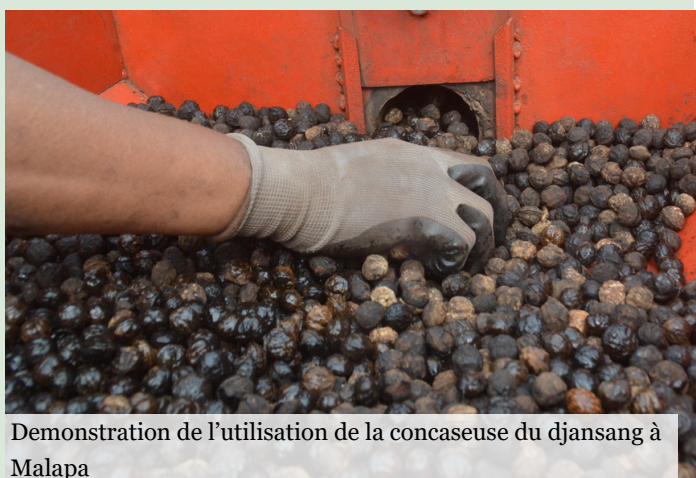
Démonstration de l'utilisation de la concasseuse du djansang à Malapa