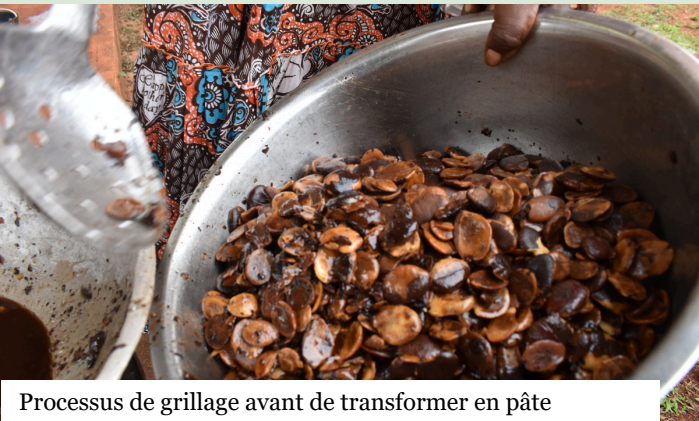
Processus de grillage avant de transformer en pâte