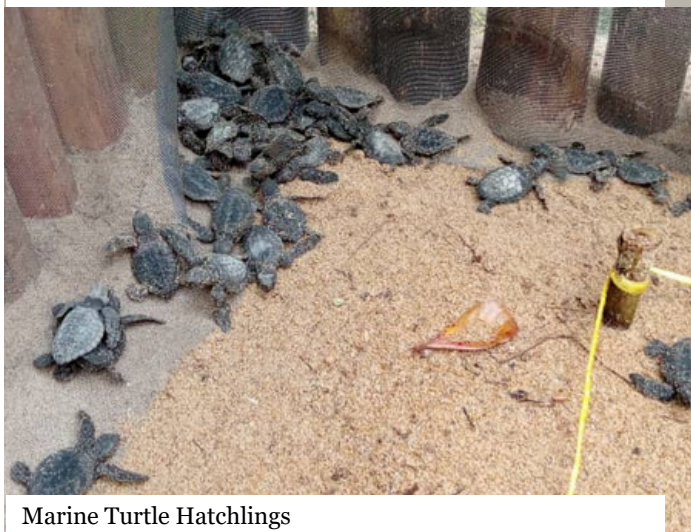
Marine Turtle Hatchlings

The first two months of 2026 have been marked by determined action along the Campo coastline. As part of the GEF-funded project “Integrated Landscape Management in the Congo Basin,” there has been a series of successfully rolled conservation and community engagement activities, combining hands-on patrols with environmental education.