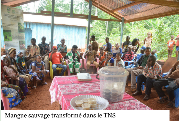
Mangue sauvage transformé dans le TNS